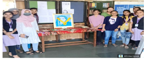
सावित्रीबाई फुले जयंती

ग्रंथालय विभागातर्फे विविध दिन, थोर व्यक्तींच्या प्रतिमेला पुष्पहार अर्पण करून, तसेच त्यांच्यावरील माहितीचे प्रदर्शन व पुस्तक प्रदर्शन भरवून साजरे करण्यात आले. ०३ जानेवारी २०२३ रोजी सावित्रीबाई फुले जयंती, १२ जानेवारी २०२३ रोजी जिजाऊ मांसाहेब जयंती, तसेच स्वामी विवेकानंद जयंती, २३ जानेवारी २०२३ रोजी नेताजी सुभाषचंद्र बोस जयंती, तसेच बाळासाहेब ठाकरे जयंती आणि ३० जानेवारी २०२३ रोजी महात्मा गांधी पुण्यतिथी साजरी करण्यात आली.