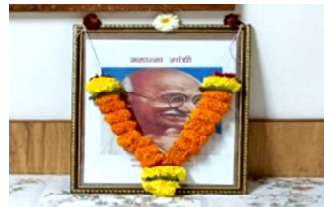
महात्मा गांधी पुण्यतिथी

नेताजी सुभाषचंद्र बोस जयंती व बाळासाहेब ठाकरे जयंती