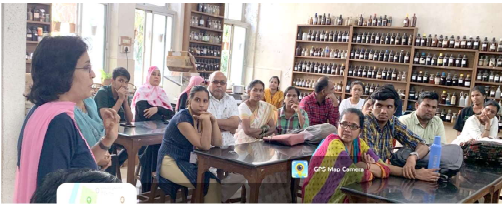
वनस्पती शास्त्र विभाग

पालकसभेच्या माध्यमातून पालकांना महाविद्यालयात आयोजित करणाऱ्या केल्या जाणाऱ्या विविध उपक्रम, पाल्याची प्रगती व विविध योजना याबद्दल माहिती देण्यात येते. महाविद्यालय व पालक यामध्ये सुसंवाद साधता येतो. वनस्पती शास्त्र विभागातर्फे २१ जानेवारी २०२३ रोजी पालक सभा द्वितीय आणि तृतीय वर्ष विज्ञान शाखेच्या विद्यार्थ्यांकरता आयोजित करण्यात आली होती. या पालक सभेला ११ विद्यार्थ्यांच्या पालकांनी आपली उपस्थिती नोंदवली. भौतिकशास्त्र विभागातर्फे २८ जानेवारी २०२३ रोजी पालक सभा द्वितीय आणि तृतीय वर्ष विज्ञान शाखेच्या विद्यार्थ्यांकरता आयोजित करण्यात आली होती. या पालक सभेला २३ विद्यार्थ्यांच्या पालकांनी आपली उपस्थिती नोंदवली.